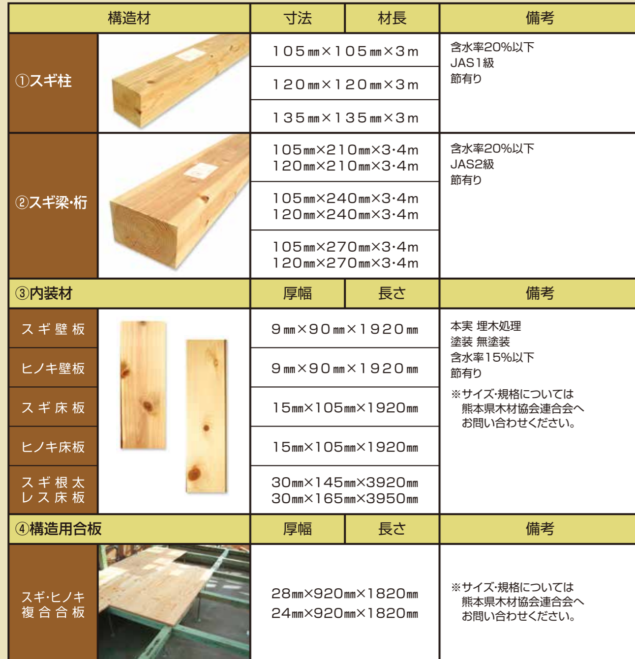
別表1 提供する県産木材一覧表